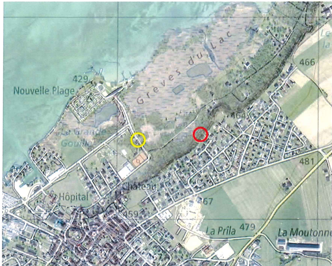
Fig. 1 Situation du site pollué : ciblérie et butte de tir en rouge, localisation de l'ancien stand en jaune